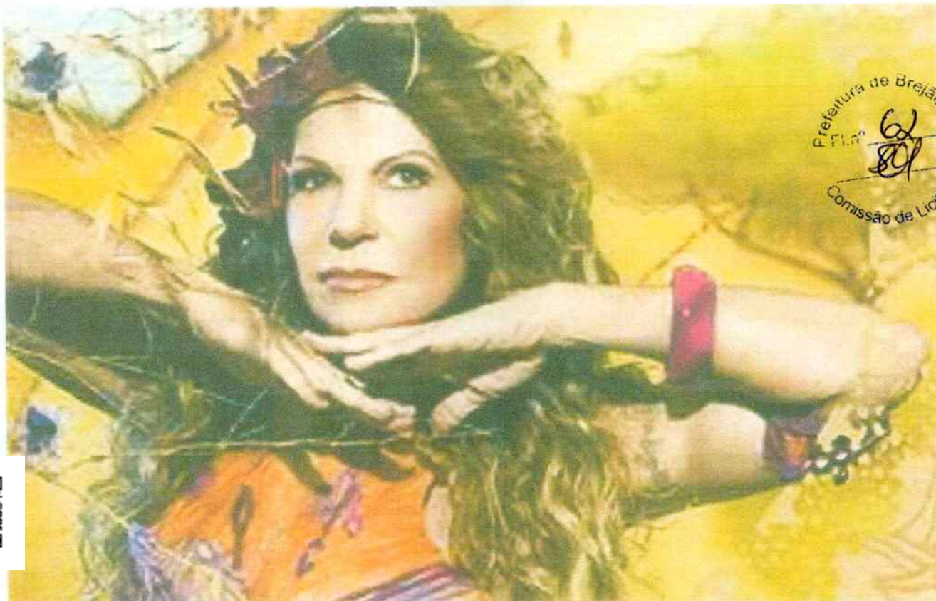
A paraibana promete cantar os sucessos De volta pro aconchego , Remexer e Bate coração