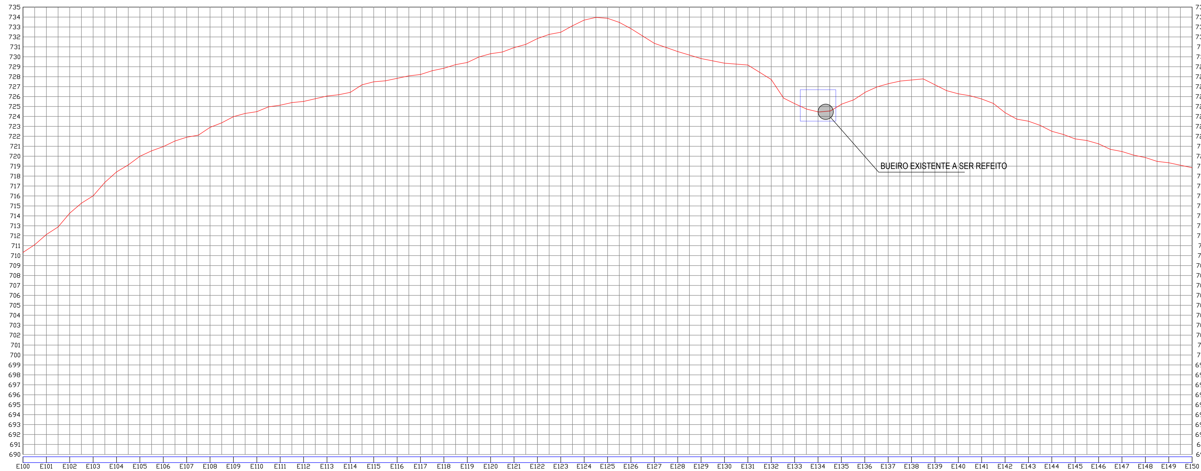
02 PERFIL LONGITUDINAL SEM ESCALA