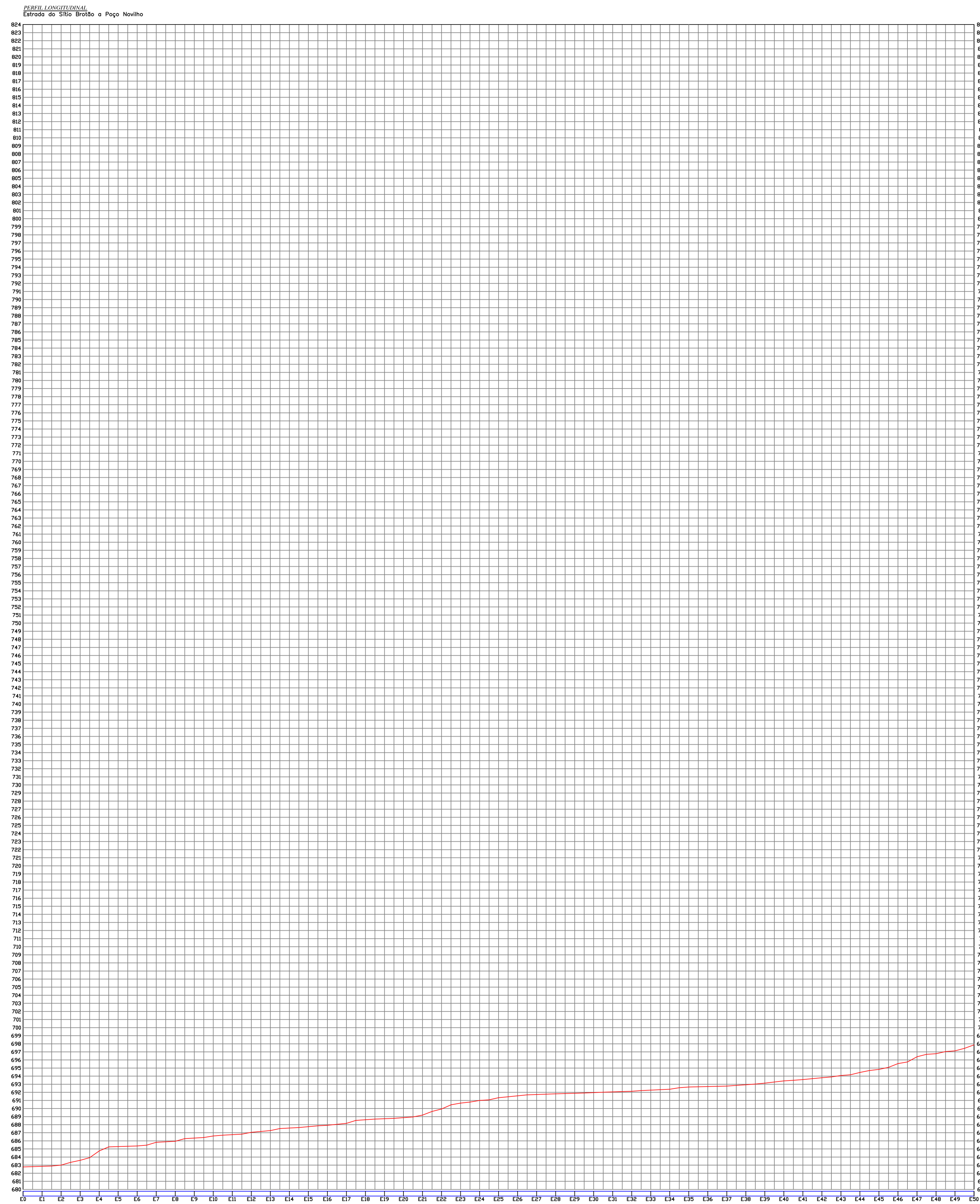
02 PERFIL LONGITUDINAL SEM ESCALA