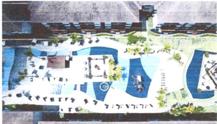
Samoa Beach Resort, em Muro Alto

“Ao entrar no negócio de short term rental nos prontificamos a ajudar na profissionalização deste setor e colocaremos todo o nosso know-how de hospitalidade a serviço dos investidores que entregarem seu apartamento para nossa gestão. Cuidaremos de tudo, desde a preparação do móvel, passando pela distribuição e venda até o serviço de atendimento aos usuários”, explica.