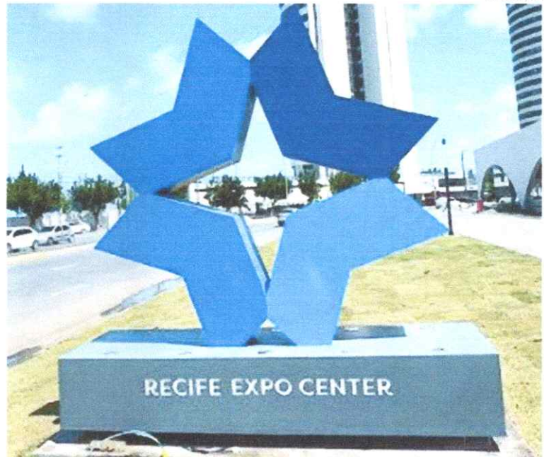
O empreendimento, que teve um investimento privado de R$ 80 milhões realizado pelo Porto Novo Recife, dispõe de dez salas multifuncionais

O primeiro evento, a feira de negócios Multimodal Nordeste 2024, segue até o dia 8 de agosto, atraindo o público da logística industrial, com a participação de mais de 80 marcas e uma expectativa de movimentação econômica superior a R$ 250 milhões. Nos três dias de evento, são esperadas aproximadamente 5 mil pessoas, entre especialistas, empresários e autoridades para discutir as tendências e desafios da logística multimodal na região.