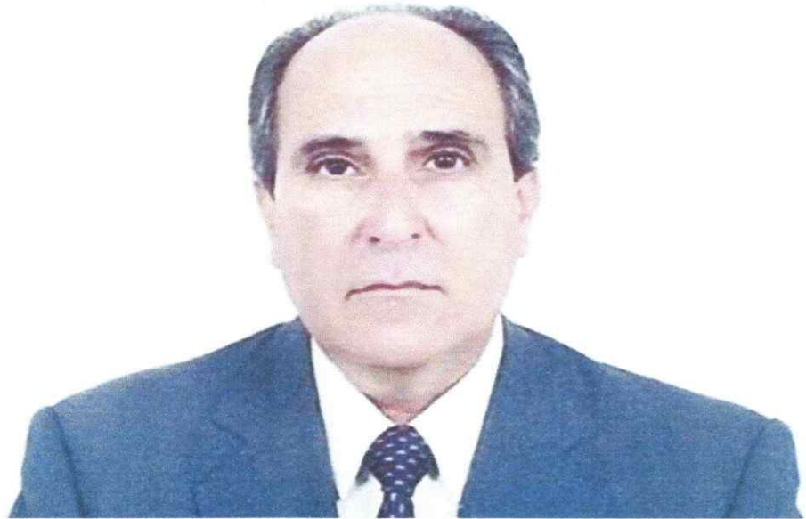
Roberto Fontes, ex-vice-governador de Pernambuco

Em sua trajetória política, Roberto Fontes foi eleito deputado estadual e federal, além de exercer o cargo de vice-governador entre 1991 e 1994