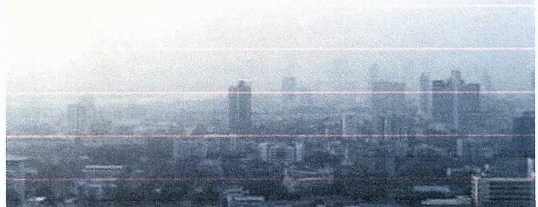
Campanha tem como objetivo aumentar o conhecimento sobre o impacto da má qualidade do ar na saúde pulmonar e as ações que podem ser tomadas para reduzi-la

As doenças respiratórias crônicas mais comuns são asma e DPOC. Aproximadamente meio bilhão de pessoas vivem com essas condições e,