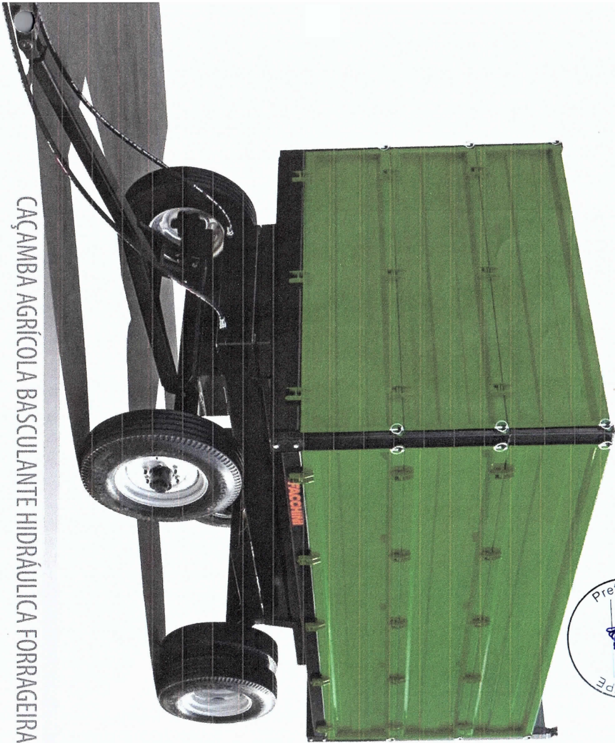
CAÇAMBA AGRÍCOLA BASCULANTE HIDRÁULICA FORRAGEIRA