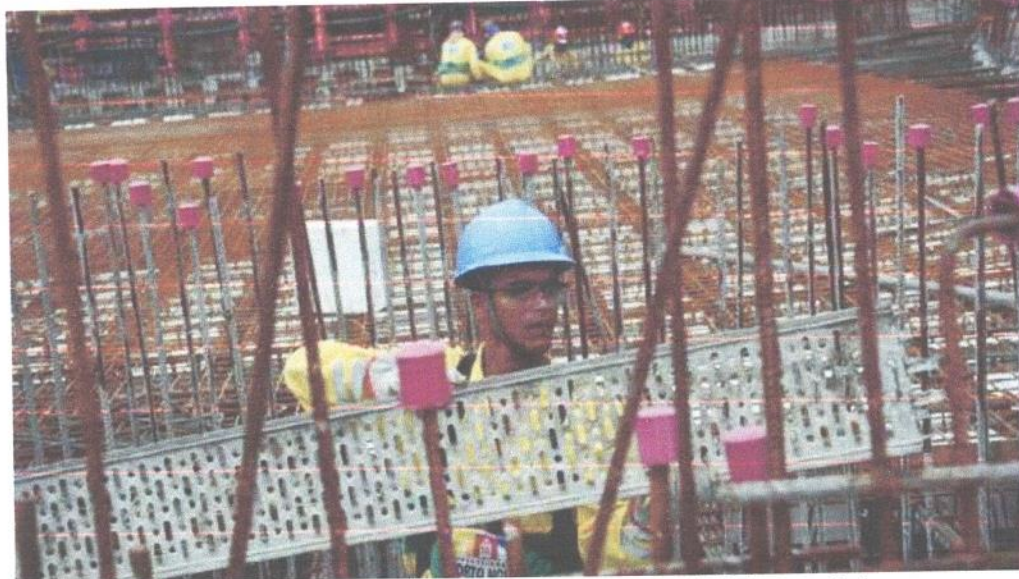
A queda na taxa mensal de setembro foi puxada pela forte inversão de preços no grupo Materiais, Equipamentos e Serviços

A tendência de freio nos custos foi generalizada, com seis das sete cidades que compõem o índice apresentando desaceleração em suas taxas