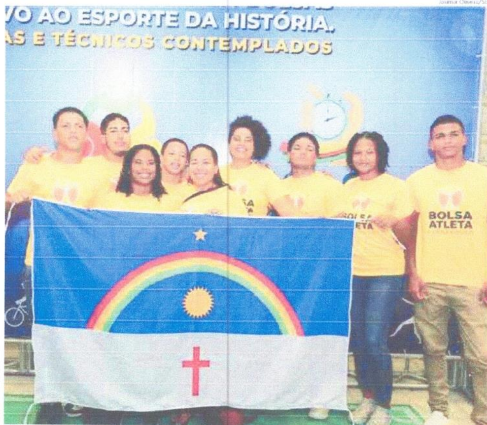
Atletas do Time Pernambuco 2026

Secretaria de Esportes de Pernambuco abriu as inscrições para Bolsa Atleta, Bolsa Técnico e Time PE 2026, com prazo até fevereiro, de forma online