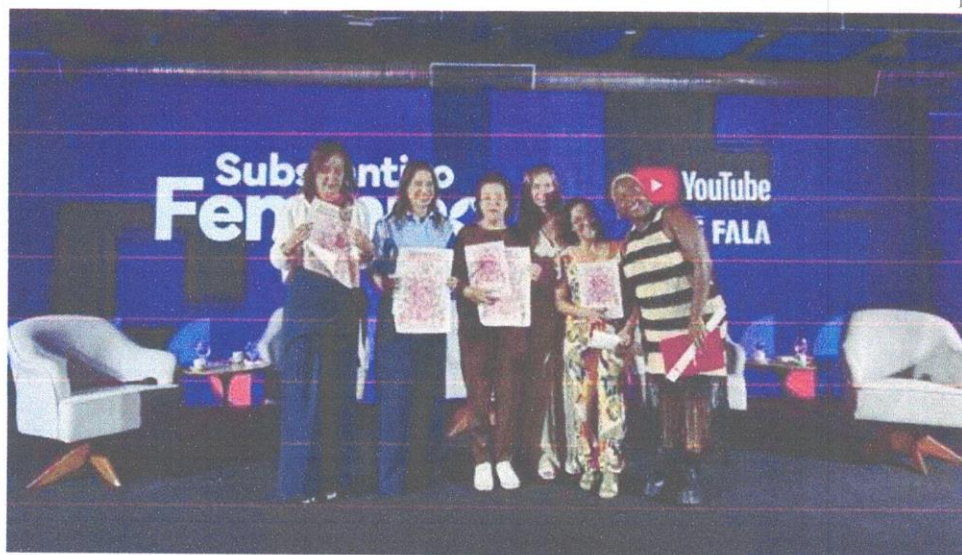
Convidadas do videocast Substantivo Feminino, iniciativa do YouTube com Casé Fala

Encontro no Cais do Sertão reuniu gestoras, artistas e produtoras culturais para discutir o protagonismo feminino na preservação do frevo