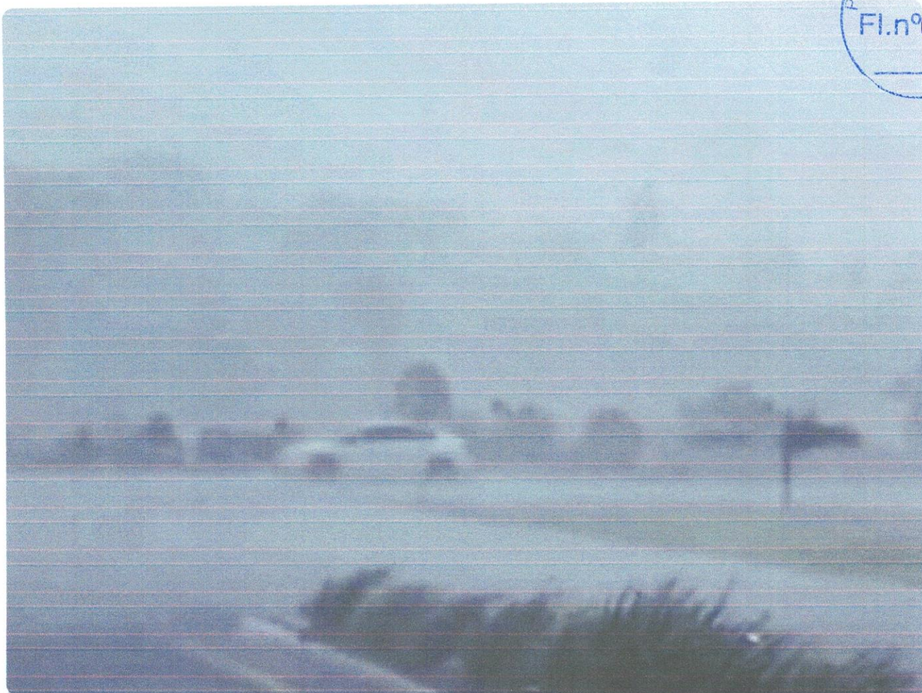
Chuva intensa em Brejão