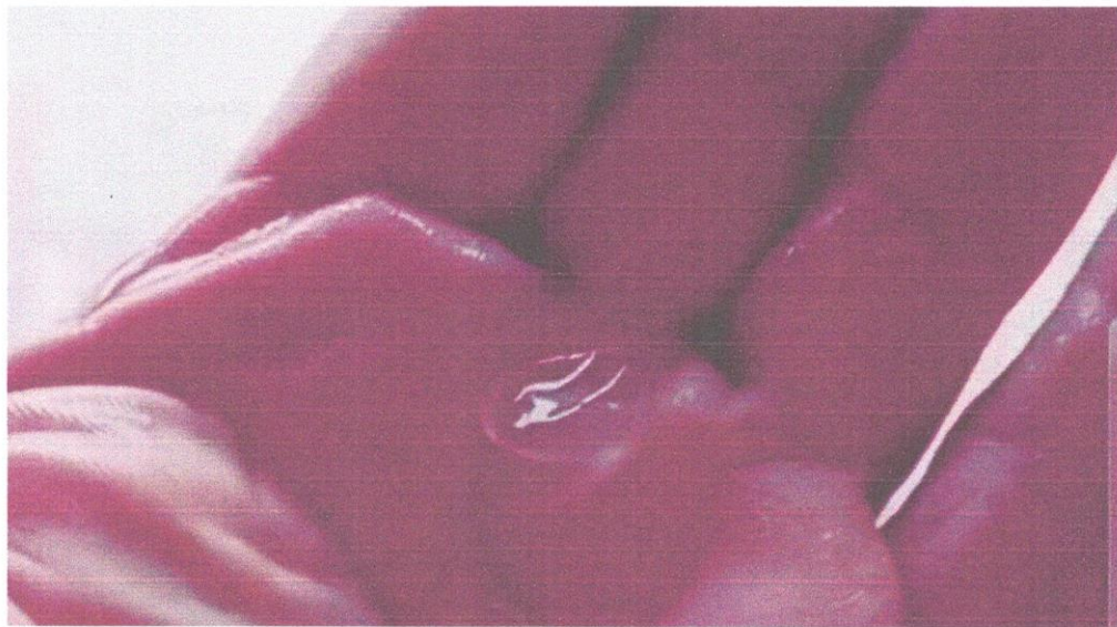
Granizo e chuva forte causam alagamentos e deixam moradores em alerta em Brejão

Uma forte chuva acompanhada de granizo surpreendeu moradores de Brejão, no Agreste de Pernambuco, na tarde da quinta-feira (19). Imagens registradas pela população mostram pequenos pedaços de gelo caindo junto com a