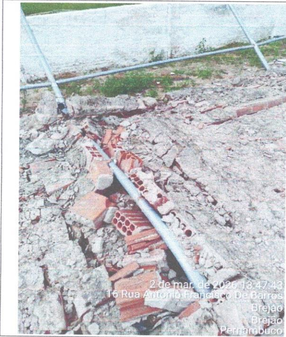
2 de mar. de 2026 13:47:43 16 Rua Antonio Francisco De Barros Brejão Brejão Pernambuco