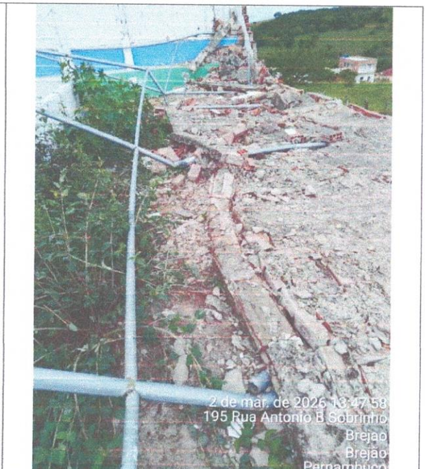
2 de mar. de 2026 13:47:58 195 Rua Antonio B Sobrinho Brejão Brejão Pernambuco