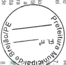
Fig. 3 de 16