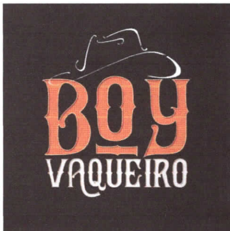
Imagem Digital da Marca

A eventual deformação desta imagem, com relação à constante do arquivo originalmente anexado, terá sido resultado da necessária adequação aos padrões requisitados para a publicação da marca na RPI. Assim, a imagem ao lado corresponde ao sinal que efetivamente será objeto de exame e publicação, ressalvada a hipótese de substituição da referida imagem decorrente de exigência formal. Portanto, se a mesma não corresponder à imagem desejada para registro nesse Órgão, substitua-a, antes de finalizar o Pedido/Petição, observando as especificações constantes do Manual do Usuário.