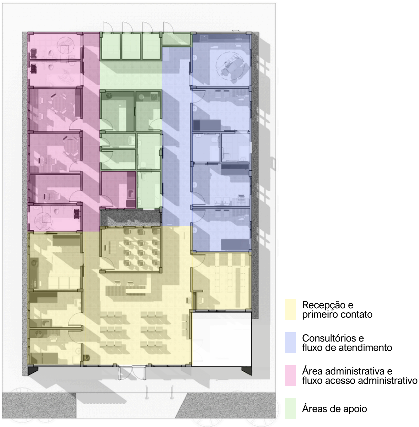
Figura 4 – Esquema para melhor compreensão do fluxo e distribuição setorizada da unidade.