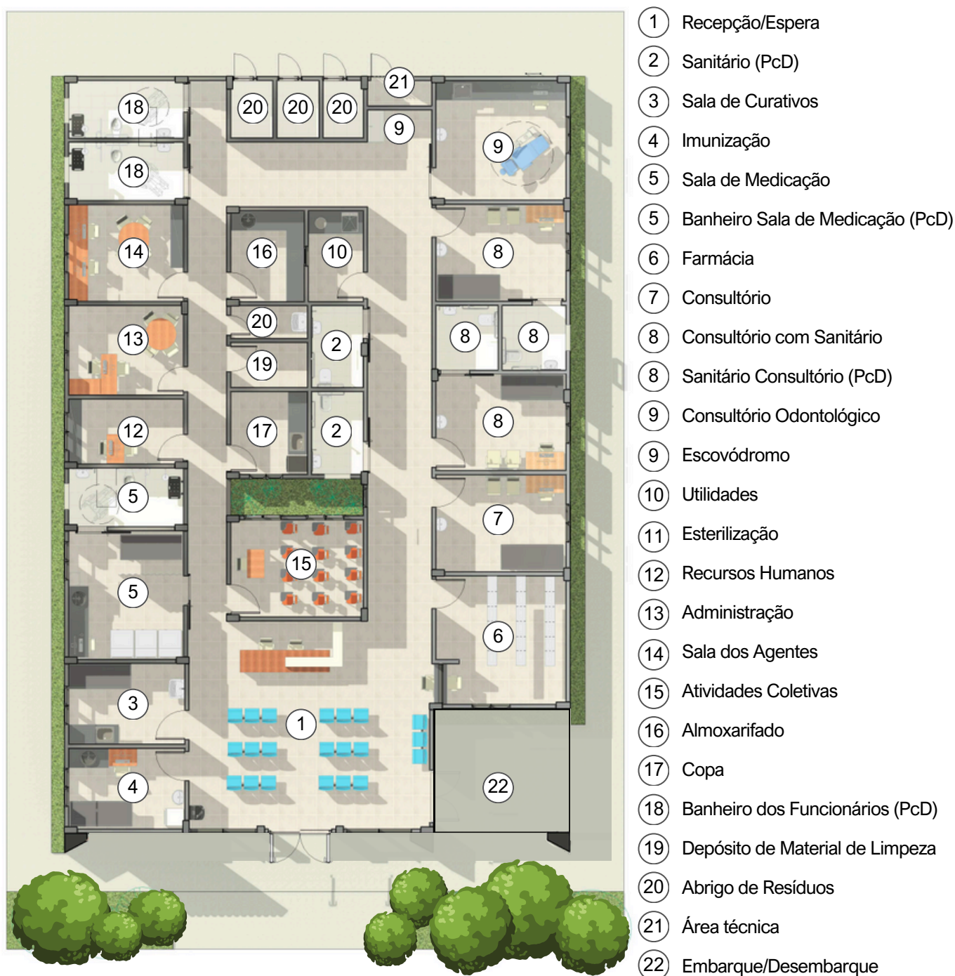
Figura 3 – Esquema para melhor compreensão da distribuição interna dos ambientes.