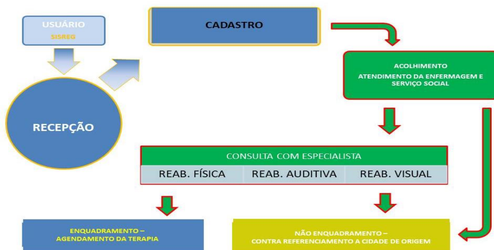
FIGURA 2: Acolhimento do paciente no CER