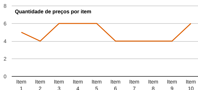
Quantidade de preços por item