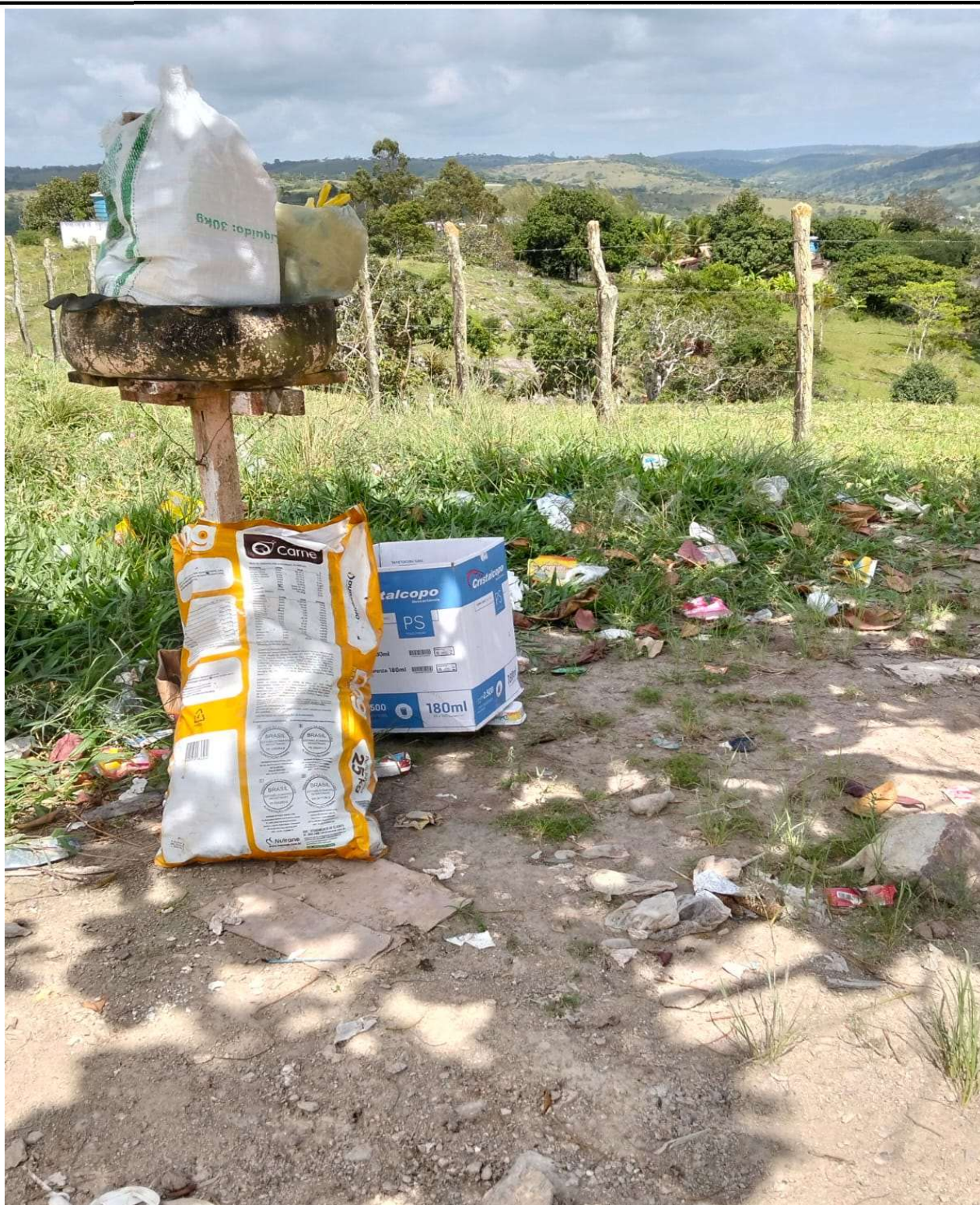
FOTO DA LIXEIRA EXISTENTE NA ALDEINHA DE CIMA