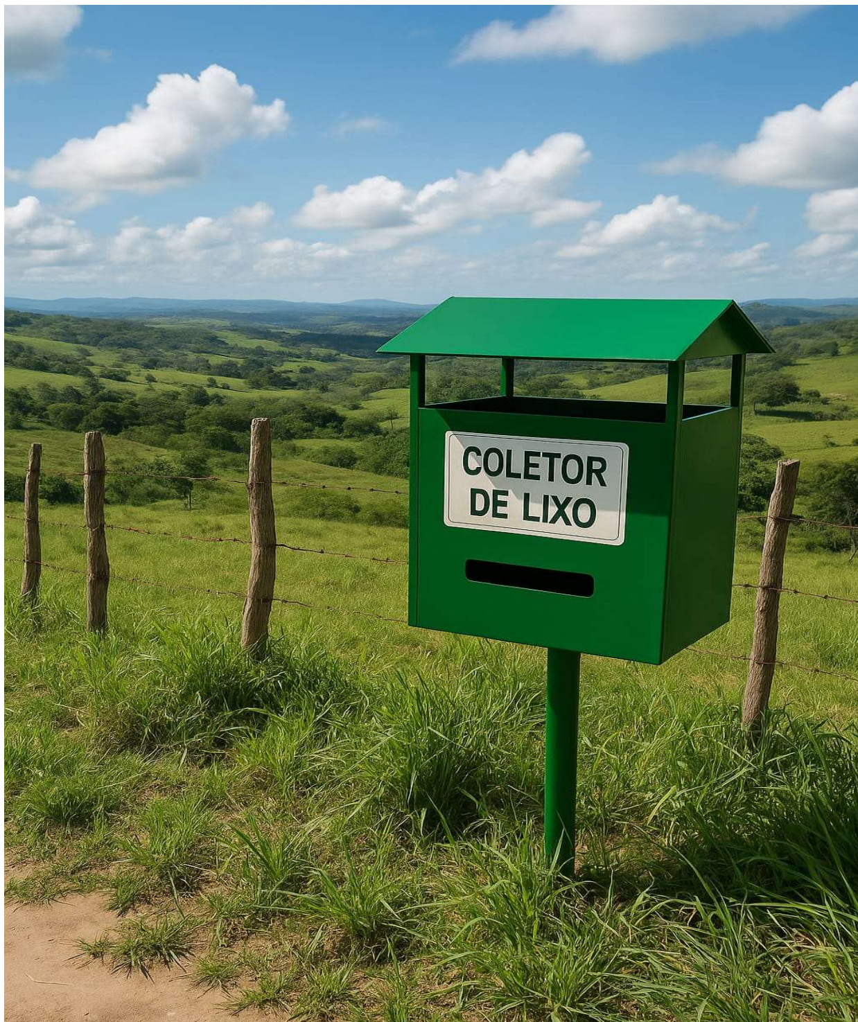
FOTO ILUSTRATIVA CRIADA COMO MODELO PARA ÁREA RURAL