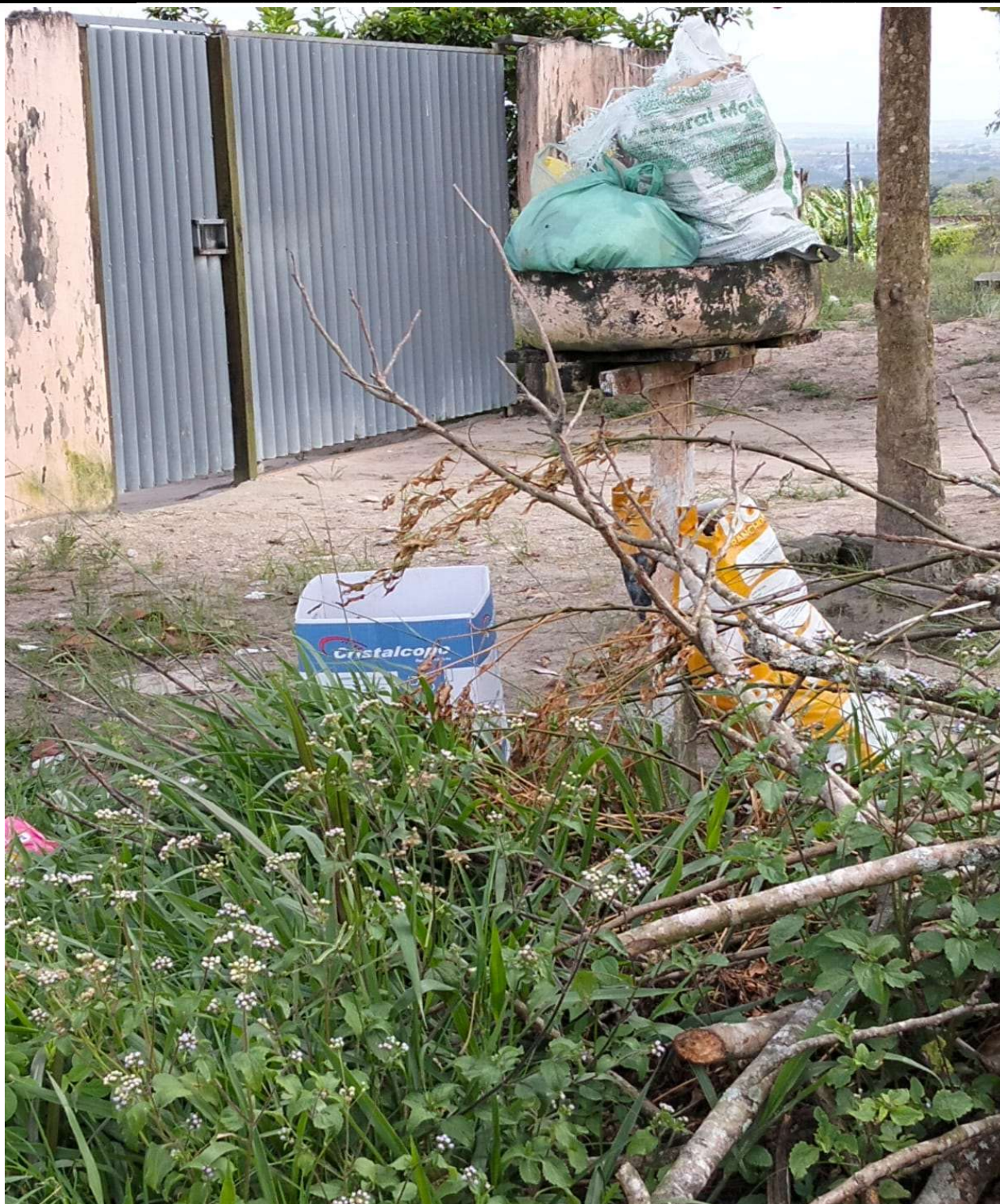
FOTO EXISTENTE DA LIXEIRA DA ALDEINHA DE CIMA PERTO DE ADRIANA DE BRÁULIO.