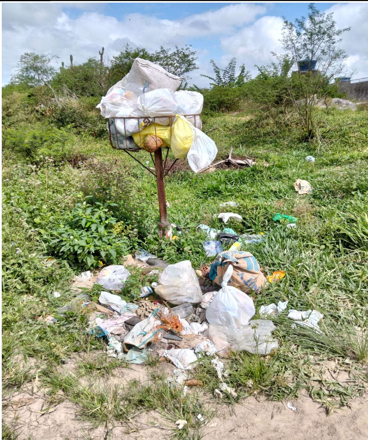
FOTO EXISTENTE DA LIXEIRA DA ALDEINHA DE CIMA PERTO DE ADRIANA DE BRÁULIO.