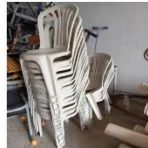
Cadeira de plástico branca