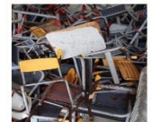
Mesa de estudante amarela