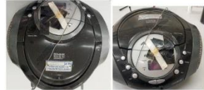
Rádio AMFM estéreo com CD da marca BRITANIA