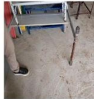
Carga de birô