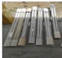
CALHAS DUPLAS GRANDES (SEM LÂMPADAS)