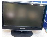
Monitor da marca POSITIVO