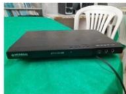
DVD MARCA MUNDIAL