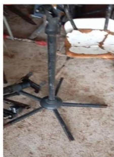
Pedestal de ferro