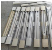
CALHAS GRANDES (SEM LÂMPADAS)