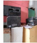
Carcasa de impressora