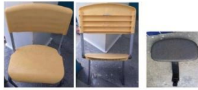
Cadeira escolar infantil