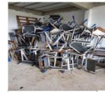
Mesa de estudante azul