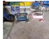
Carrinho de bebê