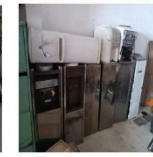
Bebedouros de coluna e Bebedouros de mesa