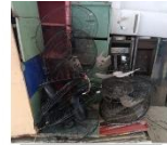
Ventilador de parede