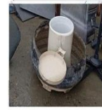
Lixeira de plástico