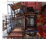
Mesa de estudante em madeira