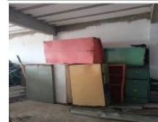
Armário de aço duas portas