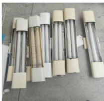
CALHAS PEQUENAS (SEM LÂMPADAS)