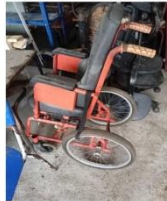
Cadeira de rodas