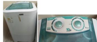
Tanquinho Lavadora Semiautomática Latina 10 Kg