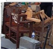
Cadeira do estudante em madeira