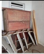
Armário de madeira