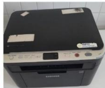
IMPRESSORA MARCA SAMSUNG