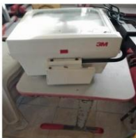
RETOPROJETOR 1800 LAAMENS M1550