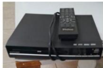
DVD MARCA MULTILASER