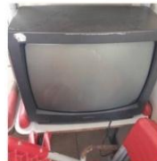
TV MARCA SONY