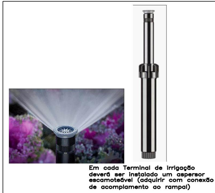
Imagem 3 – Tipo de aspersor escamoteável

A irrigação será acionada apenas por meio da entrada de serviço da COMPESA, com registro de PVC de fecho rápido.