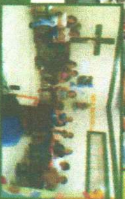
REUNIÃO COM A EQUIPE