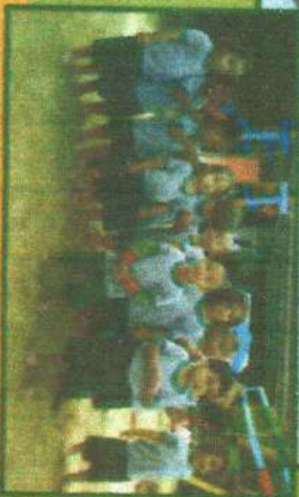
EDUCAÇÃO INFANTIL Credite e Pré-escola