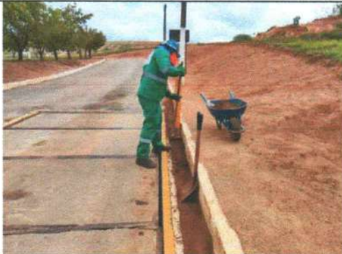
Foto 3 – Limpeza do dispositivo de drenagem da balança rodoviária