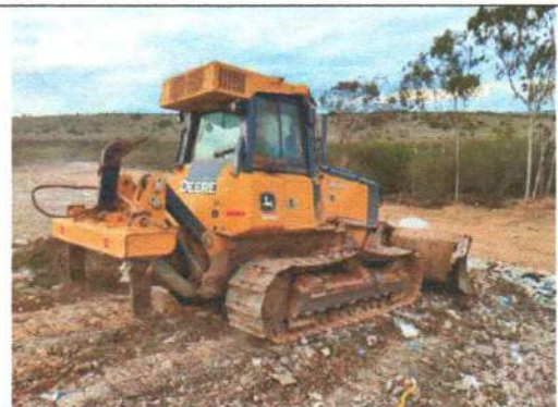
Foto 6 – Espalhamento e compactação dos resíduos na frente de operação.