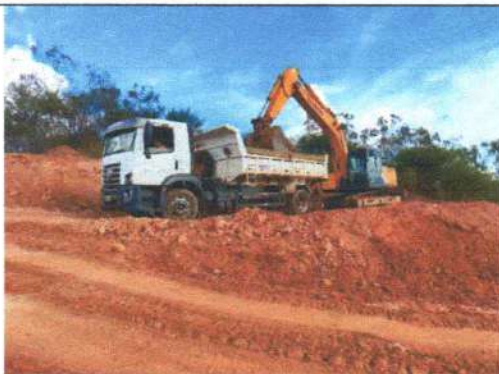
Foto 5 – Carga e transporte de solo para cobertura dos resíduos sólidos