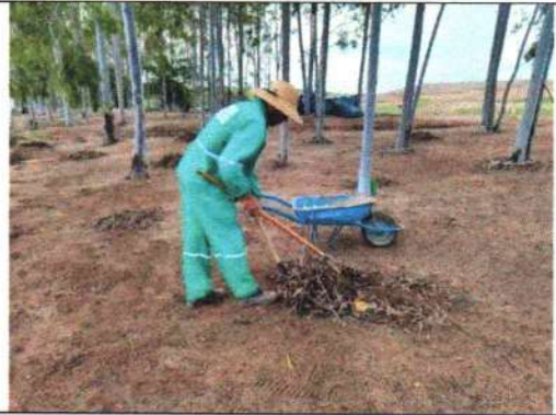
Foto 2 – Recolhimento da limpeza realizada na área da cerca viva no perímetro do aterro