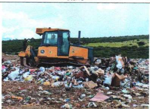
Foto 6 – Espalhamento e compactação dos resíduos na frente de operação.

1 GILDO VIEIRA DA COSTA JUNIOR:4570 3213487 Assinado de forma digital por GILDO VIEIRA DA COSTA JUNIOR:4570321 3487