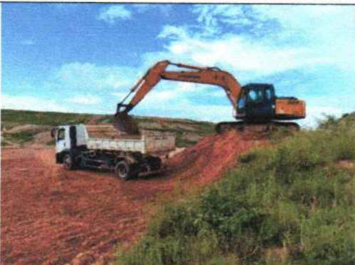
Foto 5 – Carga e transporte de solo para cobertura dos resíduos sólidos