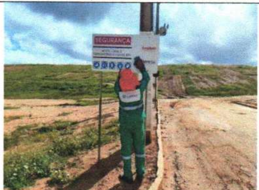
Foto 4 – Limpeza das placas de sinalização na área interna do aterro