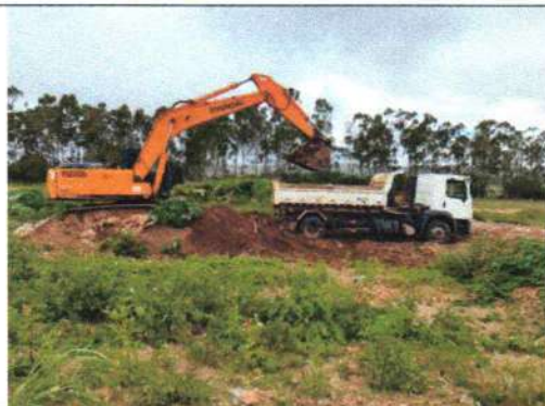
Foto 5 – Carga e transporte de solo para cobertura dos resíduos sólidos