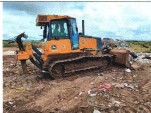
Foto 6 – Espalhamento e compactação dos resíduos na frente de operação

GILDO VIEIRA DA COSTA JUNIOR:457 03213487