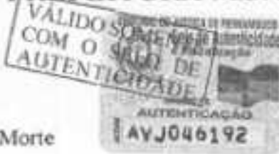
Tabella Pública Certifico que a presente fotocópia é a reprodução fiel do original que me foi exibido, dou fé