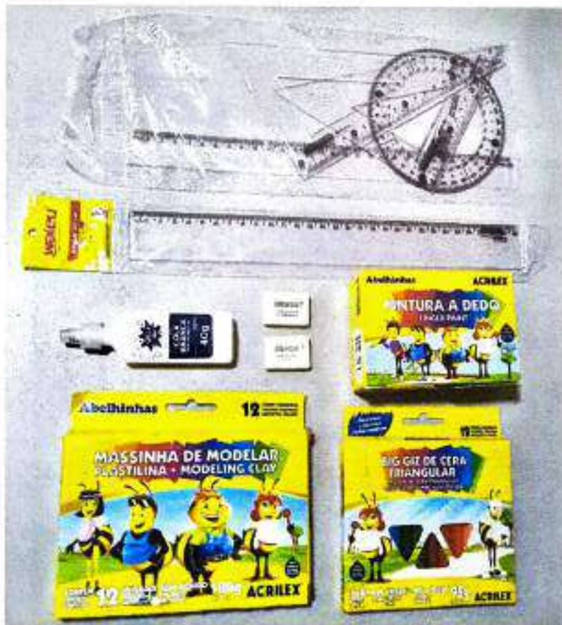
Conjunto Geométrico, Régua 30cm, Cola, Borracha, Tinta para Pintura a Dedo, Massa de Modelar e Gizão de Cera