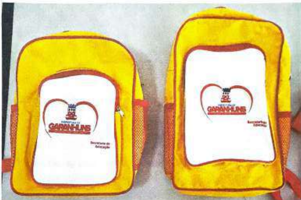
Bolsas Kit Infantil (E) e Kit Anos Iniciais (D)