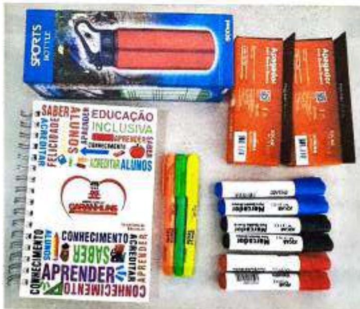
Garrafa de Alumínio 600ml, Apagador, Caderno X/4, Marcador de Texto e Pincel para Quadro Branco fornecidos no Kit do Professor