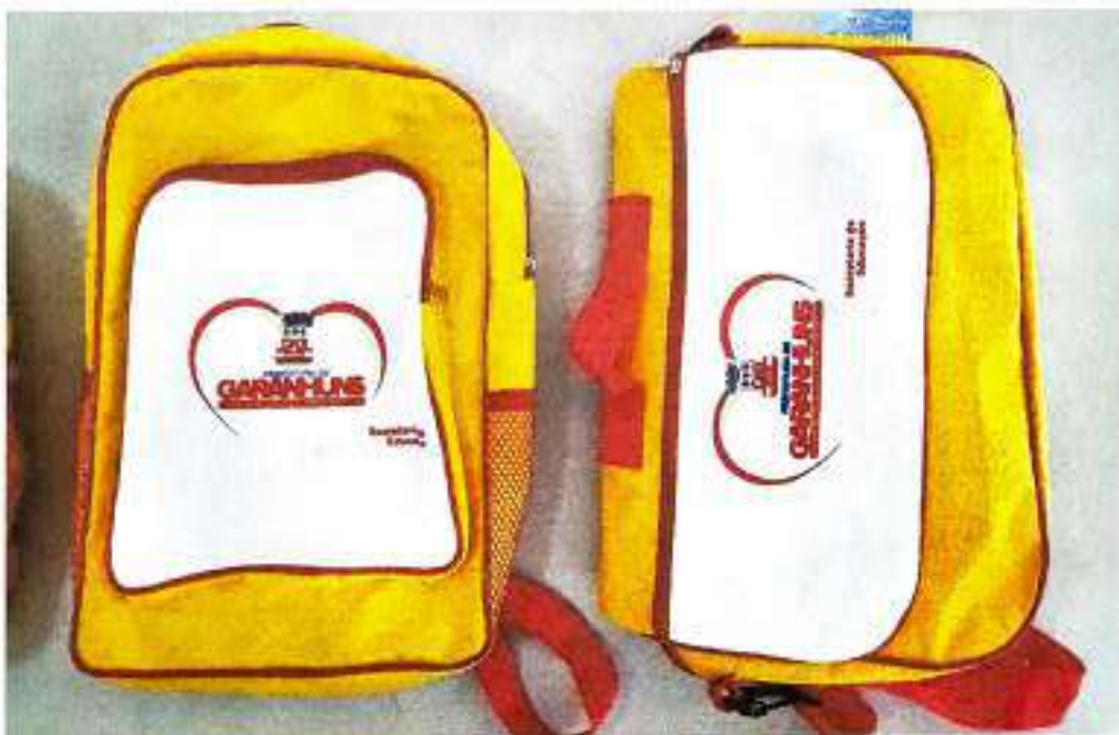
Bolsas Kit Anos Finais (E) e Kit Professor (D)