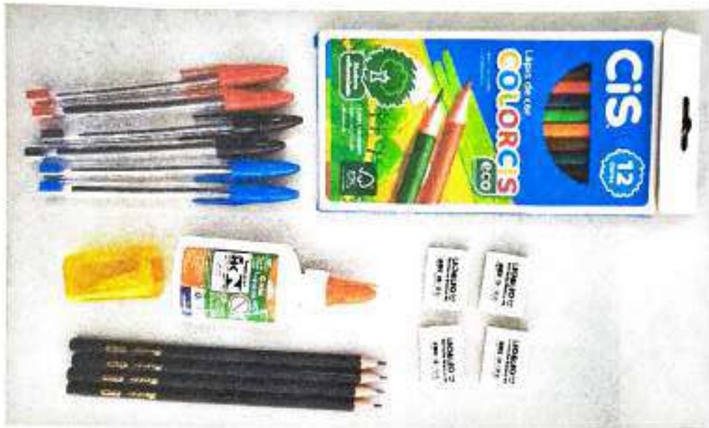
Canetas Esferográficas, Lápis de Cor, Apontador, Cola, Borracha e Lápis Grafite