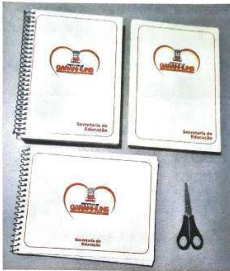
Caderno Universitário, Caderno Brochurão, Caderno de Desenho e Tesoura Escolar